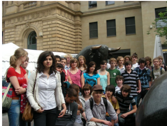
Der Wahlpflichtkurs vor der Börse